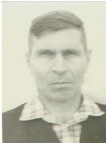
фото 70-х годов.

Освободили их наши войска, когда освобождали Польшу.