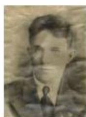
учитель Армизонской школы