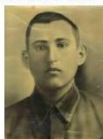
учитель Армизонской школы