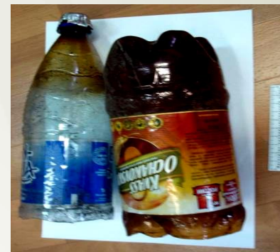
Самодельные приспособления для курения наркотических средств